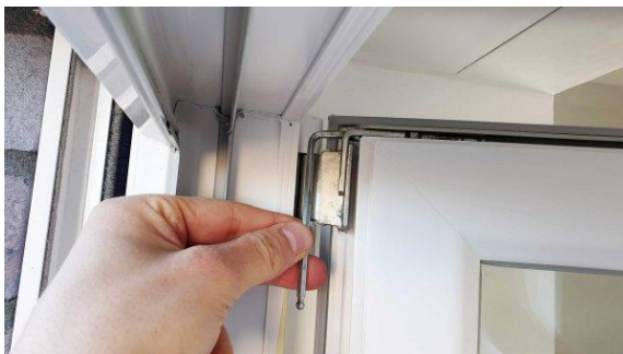
Am Scherenlager das Fenster einstellen – Mit einem Inbusschlüssel kommt man hier im geöffneten Zustand gut ran.

4. Schritt: Kontrolliere die Abstände bei deinen Markierungen. Sind sie gleich?