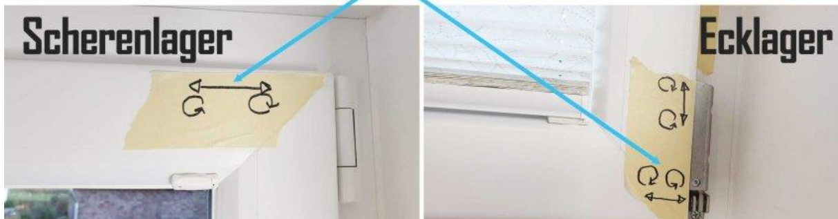
Fenster seitlich verschieben: Drehe die Schrauben entsprechend dem Bild am Scheren- und Ecklager gleichmäßig.