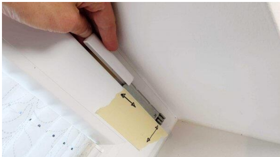
Ecklager am Fenster: Kappe entfernen. Diese kann nach oben geschoben werden.